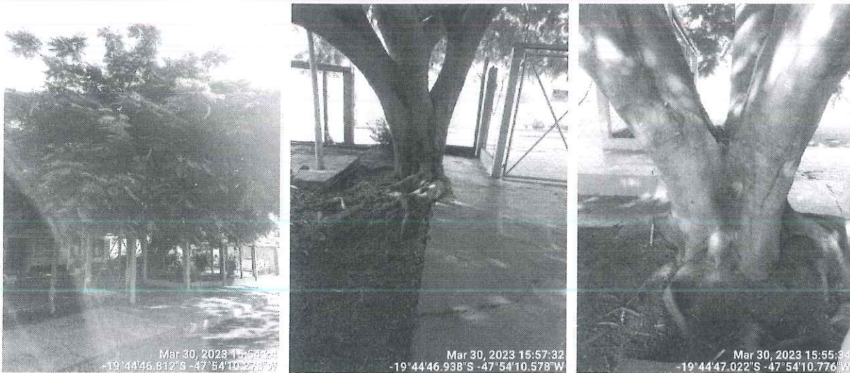
Figura 1 – Flamboyant.

Diante do exposto, encaminhamos o Relatório Técnico e a Autorização nº 91/2023 para conhecimento e providências cabíveis.